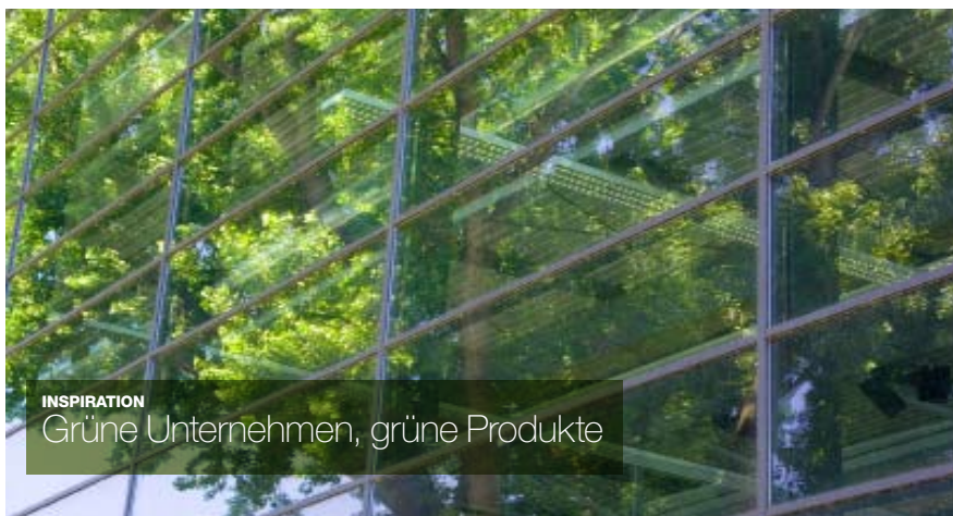
INSPIRATION Grüne Unternehmen, grüne Produkte